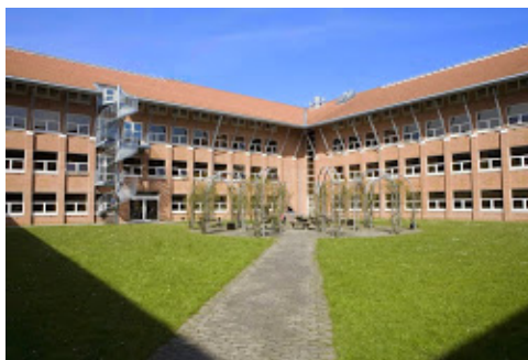
CPH West Gymnasierne